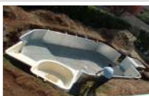
Mise en place des palplanches ainsi que l'escalier polyester. Réalisation du radier béton.

LA PISCINE DOUBLE PAROI RENFORCEE Gage d'économie d'énergie