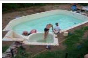
Pose du liner