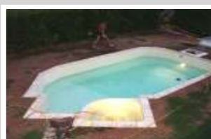
Réalisation du chaînage Pose des margelles