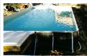
Piscine mise en eau sans être remblayée