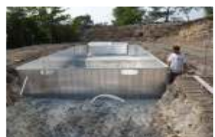
Mise en place des palplanches ainsi que l'escalier polyester. Réalisation du radier béton.