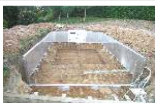
Pose de la structure avant dalle de fond