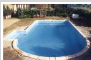
Réalisation du chaînage Pose des margelles