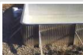
Détail angle système ALURAID