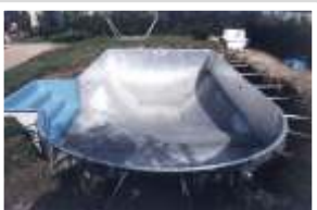
Mise en place des palplanches ainsi que l'escalier polyester. Réalisation du radier béton.