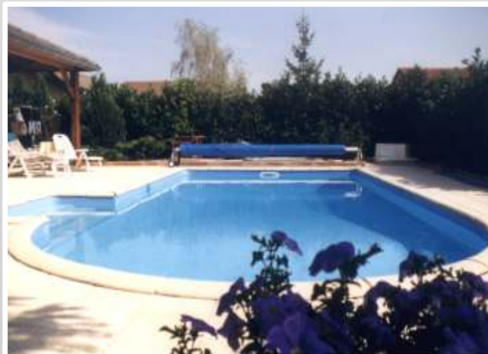
Pose du dallage