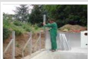
Pose d'une palplanche Aluraid par emboîtement dans la poutre inférieure.

LA PISCINE AUTOPORTANTE Remblaiement directement avec la terre d'excavation