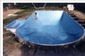
Pose du liner. Remblaiement par la terre d'excavation.